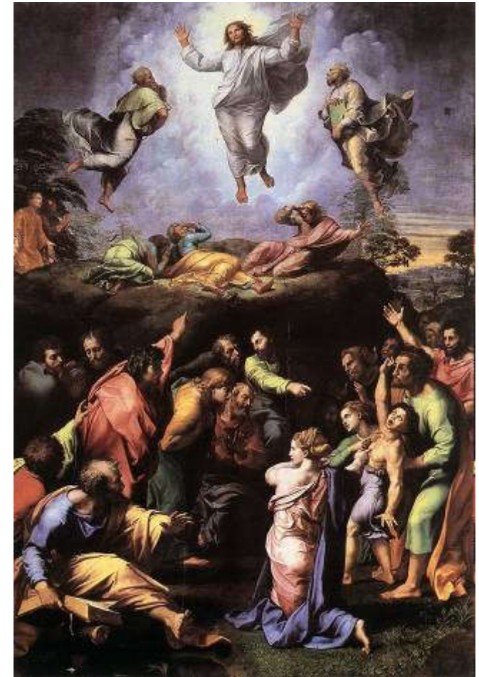
Rafael, Preobraženje, 1518-20, ulje, Vatikan