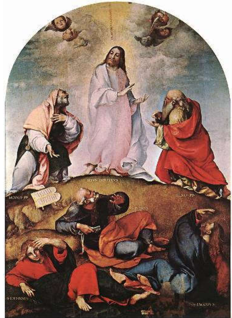
Lorenzo Lotto, Preobraženje, 1510-20, Recanati