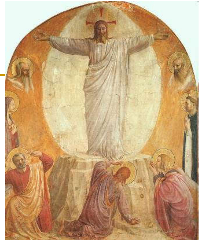
Fra Angelico, Preobraženje (1440-41), freska, samostan sv. Marka, Firenca