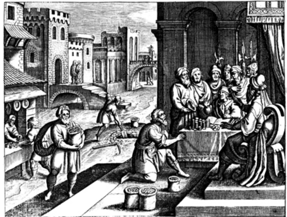
Matthäus Merian stariji, Parabola o talentima, 1625.-30.