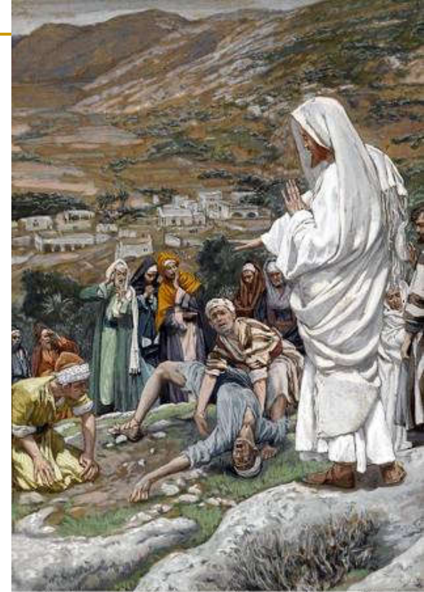
The Possessed Boy at the Foot of Mount Tabor by James Tissot