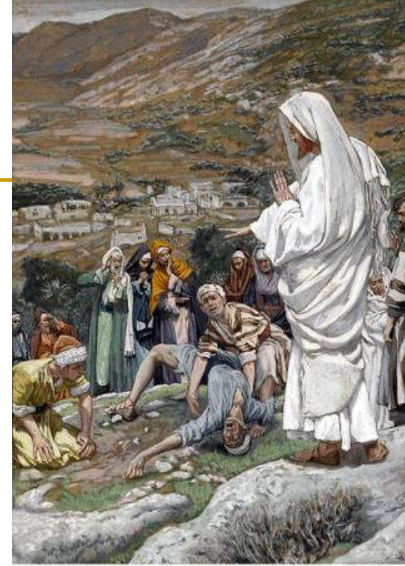
The Possessed Boy at the Foot of Mount Tabor by James Tissot