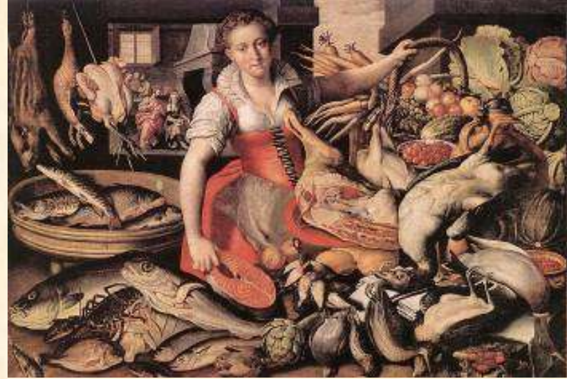
Vincenzo Campi, Krist u Marijinoj i Martinoj kući, Galleria Esense, Modena