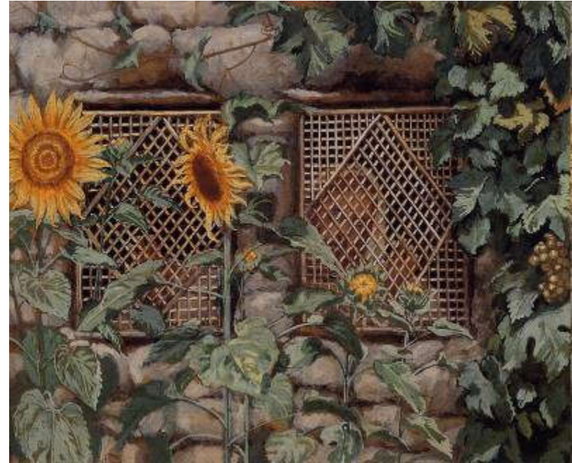
J. Tissot, "Zaviruje kroz rešetku" Pj 2,9b Usp. 5,2b