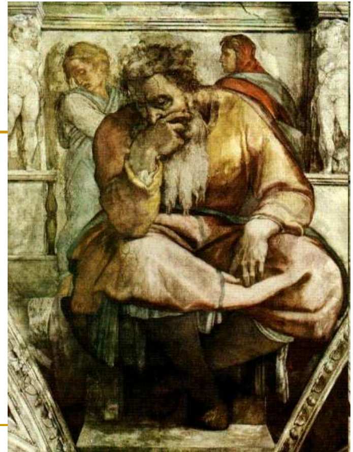
Michelangelo, Jeremija, Sikstinska kapelica