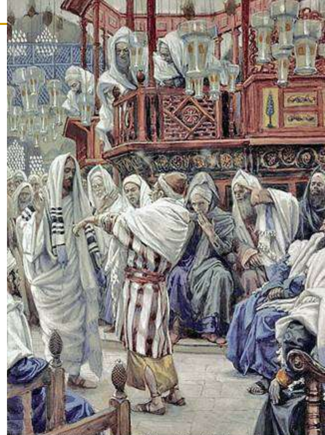
Christ Healing the Withered Hand by James Tissot