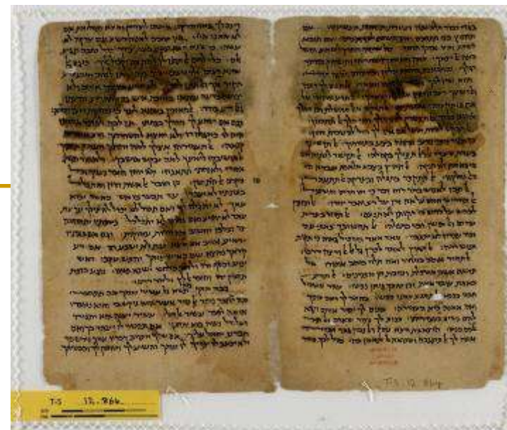
Odlomak na hebr. Sir 5,10–7,29; 11,34–14,11 u Cambridgeu