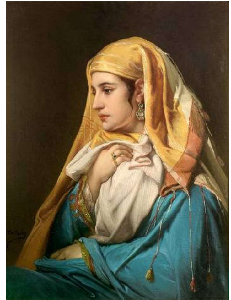
Jean-François Portaels 1818 – 1895 Belgijski slikar – orientalist Kći Sionska