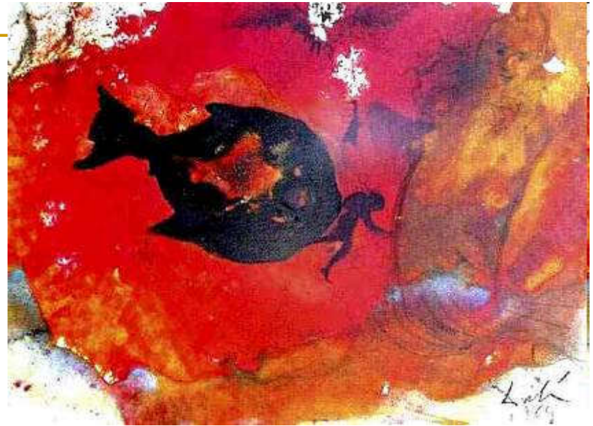
S. Dalí, Jona u ribljoj utrobi, Sacra Biblia 1964-1967