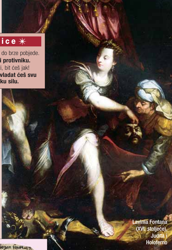
Lavinia Fontana (XVI. stoljeće), Judita i Holoferno