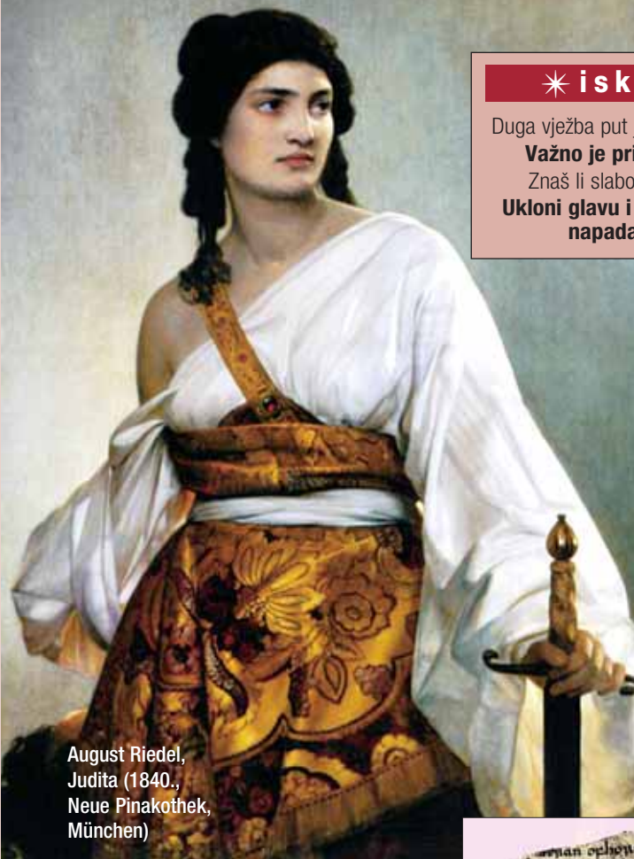
August Riedel, Judita (1840., Neue Pinakothek, München)

Ukloni glavu i svladat ćeš svu napadačku silu.