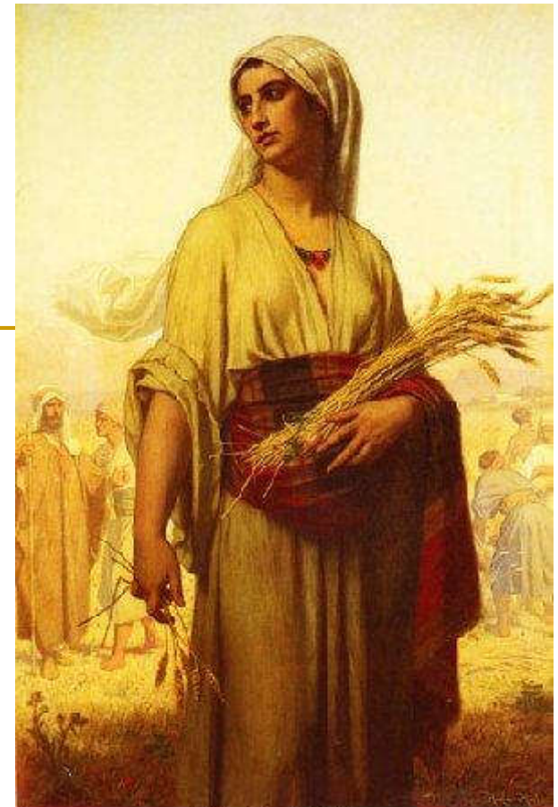
"Ruth in the Fields" By Hugues Merle (1823-1881)