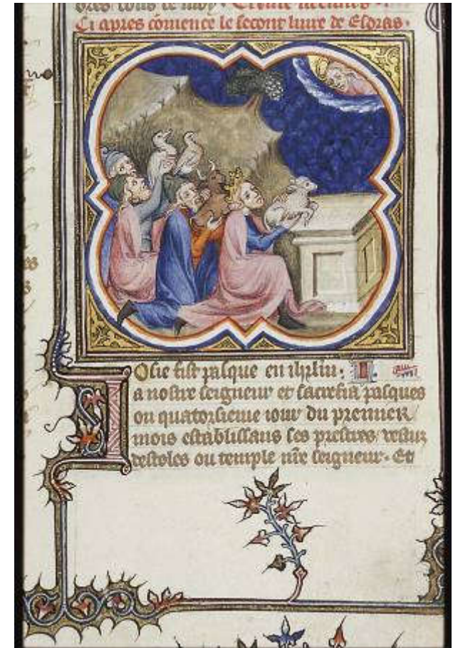
Minijatura, Petrus Comestor, Bible Historiale, Francuska, 1372