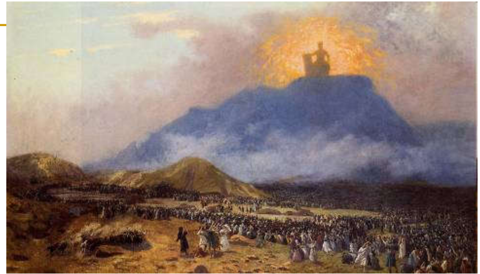
Jean-Léon Gérôme, Mojsije na gori Sinaju (1895-1900)