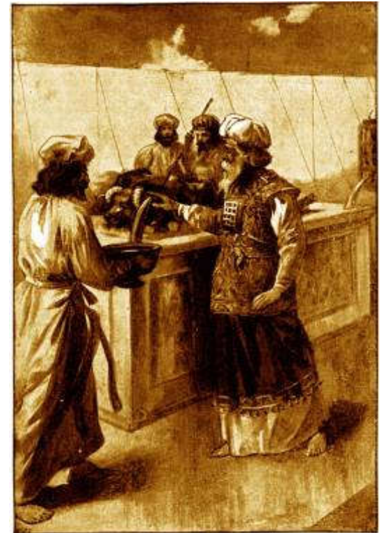
AARON AND HIS SONS PREPARING A BURNT SACRIFICE—LEV. 1 and 10. 18.