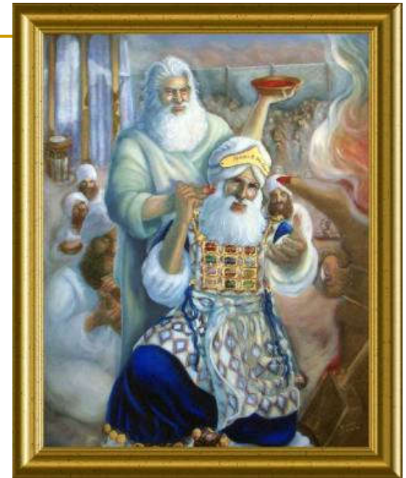
Darlene Slavujac, Mojsije posvećuje Arona, ulje na platnu, 1994.