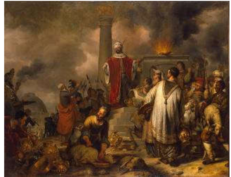
Jeroboam's Sacrifice at Bethel 1656 Eeckhout, Gerbrandt Jansz van den