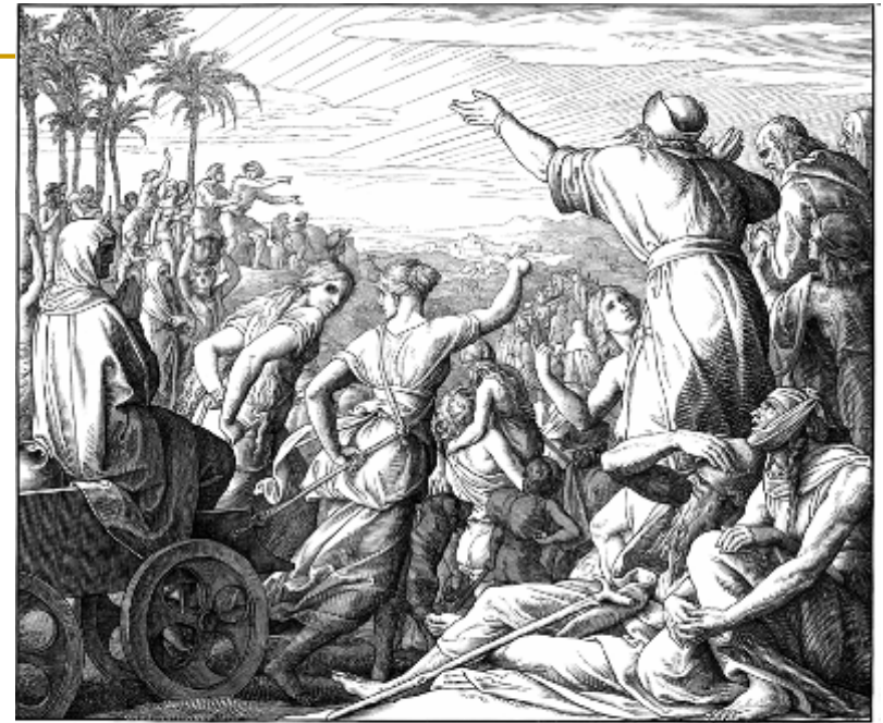
Die Künfte aus der babylonischen Gefangenhaft. Da sprach der HERR zu Jeremia dem Propheten, als die Könige von Babel kamen, um Jerusalem zu zerstören. Aus Jer. Kap. 1. v. 1.

J. Schnorr von CAROLSFELD, Kir oslobađa Židove