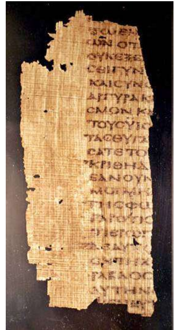
Papirus s opisom gorućega grma, IV. st. Egipat.