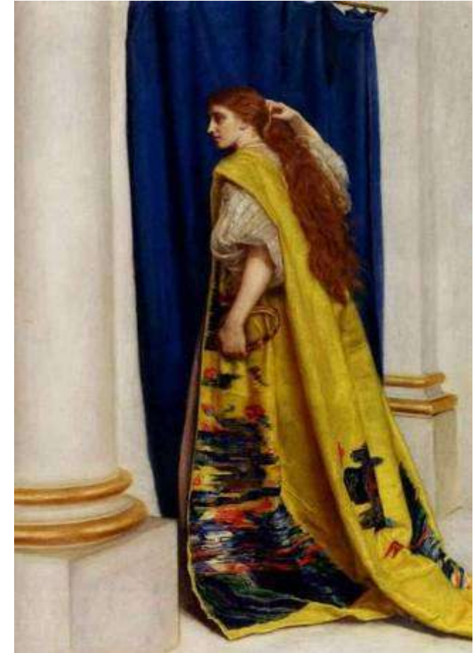
Sir John Everett Millais (1829-96)