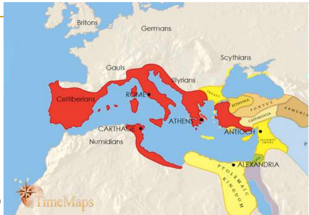
Rimsko carstvo 200. – 100. pr. Kr