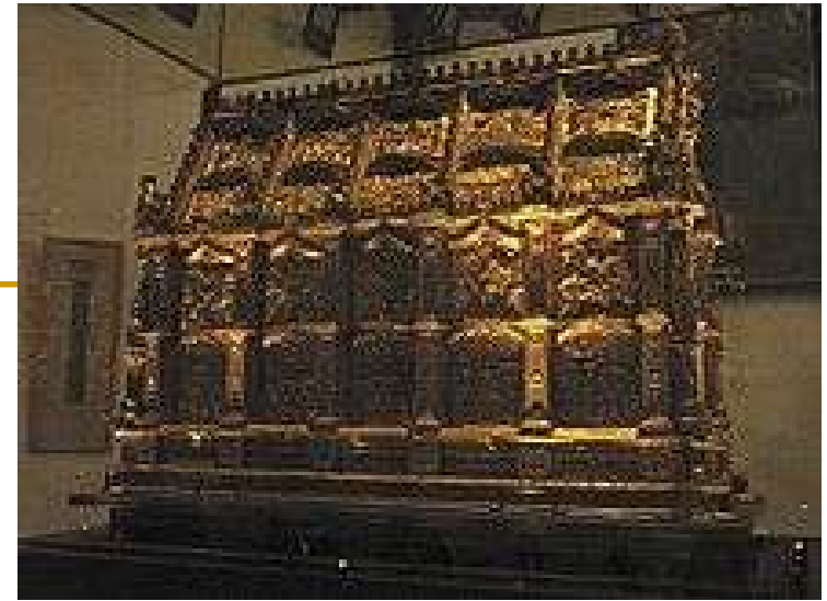
Relikvije Makabejaca u crkvi Sv. Andrije u Kölnu