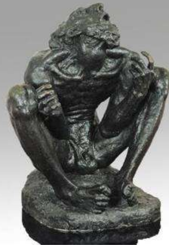
I. Meštrović, Job