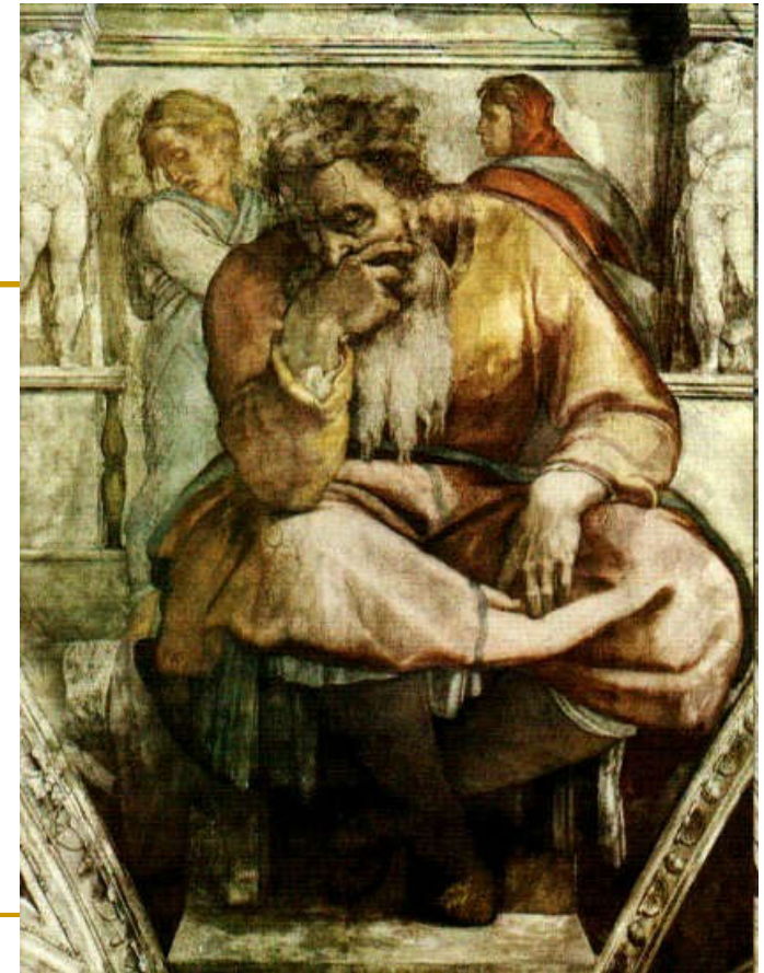
Michelangelo, Jeremija, Sikstinska kapelica