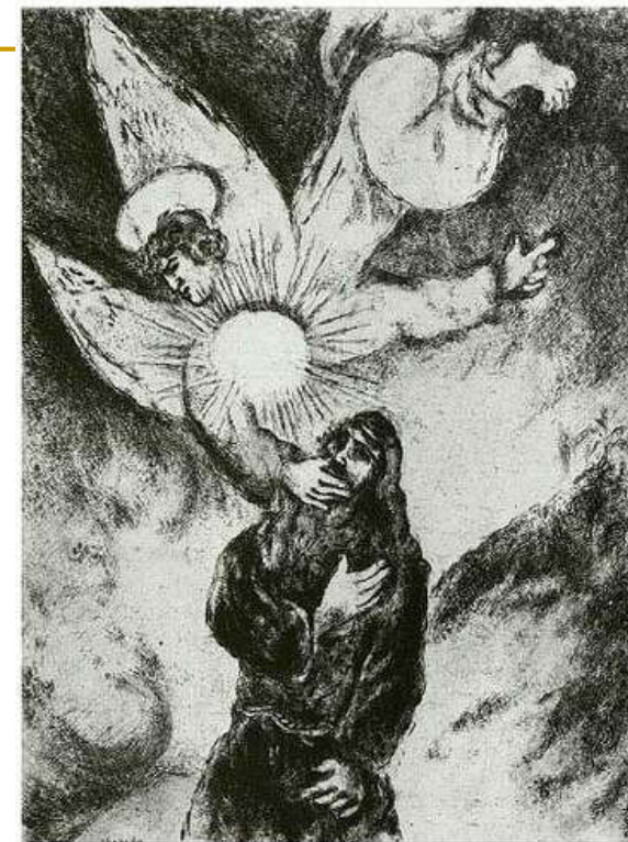
M. Chagall, Jeremijino zvanje, 1956.