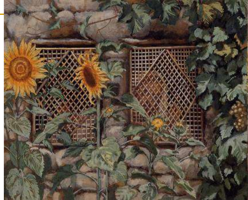
J. Tissot, “Zaviruje kroz rešetku” Pj 2,9b Usp. 5,2b