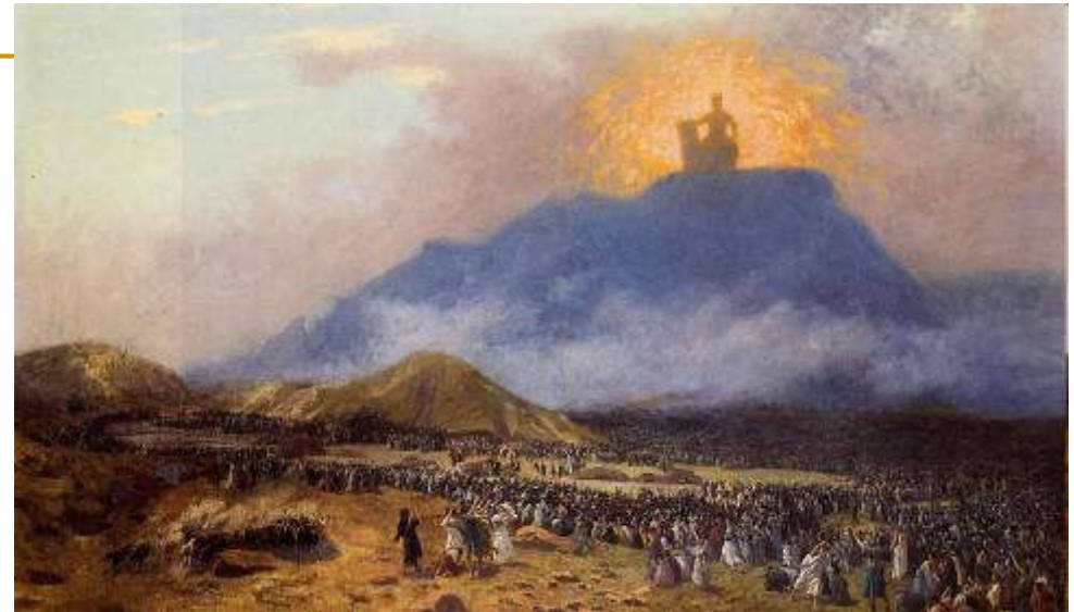
Jean-Léon Gérôme, Mojsije na gori Sinaju (1895-1900)