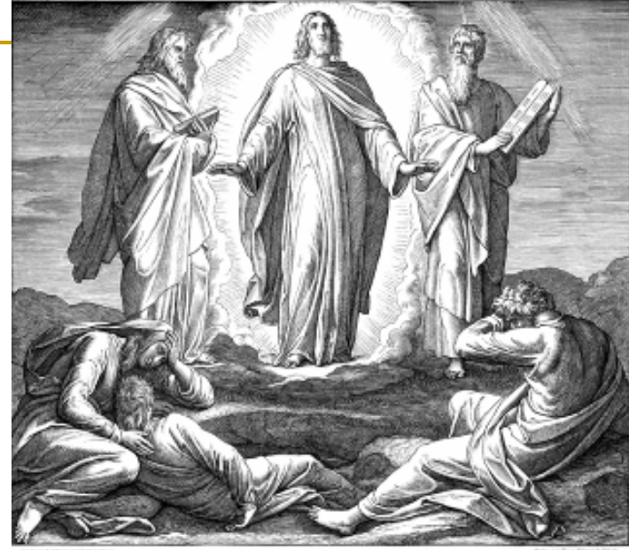
Die Verkündung Jesu.

Ein Bild von Schinkel aus dem Jahr 1824. Die Verkündung Jesu, von der Hand des Malers Schinkel, 1824. Die Verkündung Jesu, von der Hand des Malers Schinkel, 1824. Die Verkündung Jesu, von der Hand des Malers Schinkel, 1824.