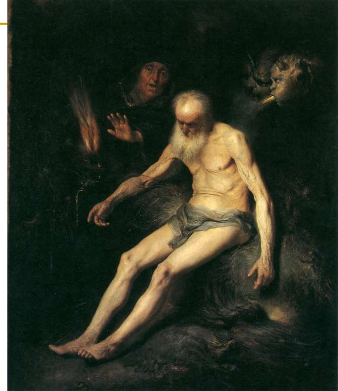
Jan Lievens, Job on the Dunghill, 1631