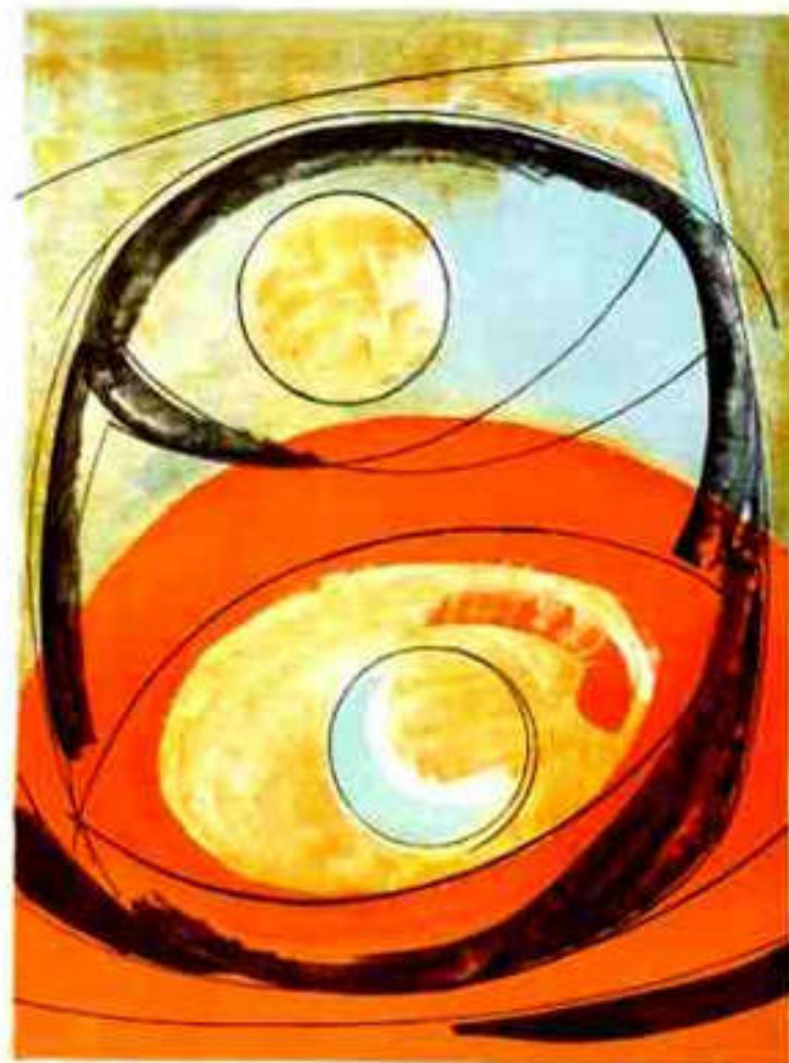
Barbara Hepworth, Postanak, litografija, 1969.