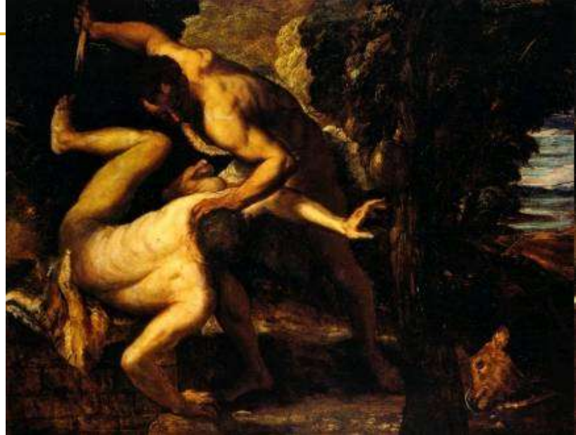
Tintoretto 1518 – 1594, Kajin i Abel ; ulje na platnu (149 × 196 cm) — 1550-53