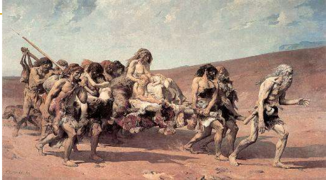
Fernand Cormon (1880), Kajin u zemlji Nod, Paris