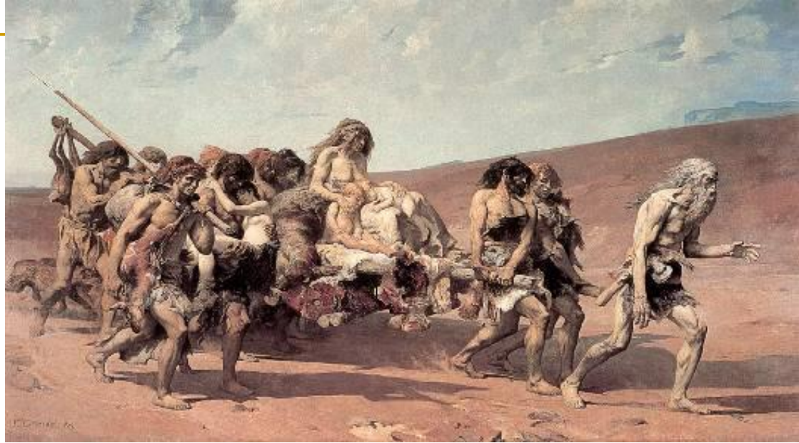
Fernand Cormon (1880), Kajin u zemlji Nod, Paris