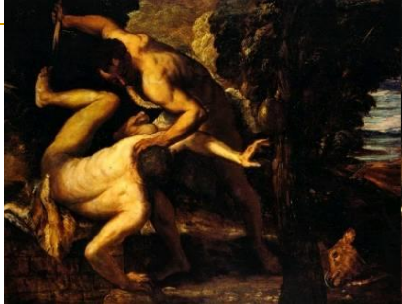
Tintoretto 1518 – 1594, Kajin i Abel ; ulje na platnu (149 × 196 cm) — 1550-53