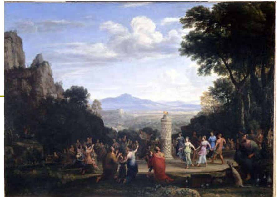
Lorrain Claude, Klanjanje zlatnom teletu, 1660.