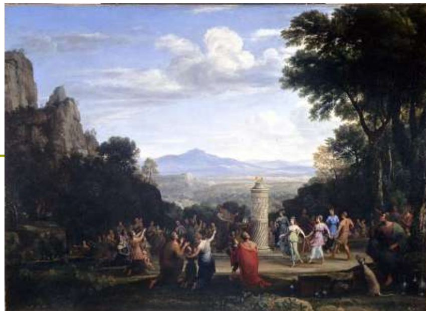
Lorrain Claude, Klanjanje zlatnom teletu, 1660.