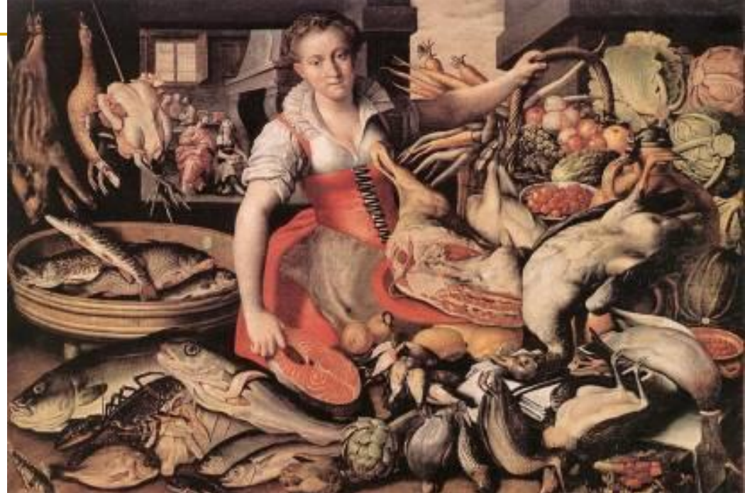
Vincenzo Campi, Krist u Marijinoj i Martinoj kući, Galleria Esense, Modena