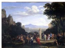
Lorrain Claude, Klanjanje zlatnom teletu, 1660.