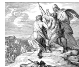
J. Schnorr von Carolsfeld, Aron i Hur drže Mojsijeve ruke (Bibel in Bildern)