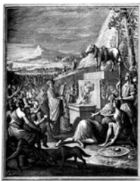
Mojsije (desno) gleda kako se u Šatoru izrađuje zlatno tele. Mojsije i svi izraeliti su bili prisiljeni gledati kako se zlatno tele izrađuje. Mojsije je rekao: „Bacio sam zlato u vatru i izišlo je tele.“