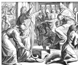
Moses und Aaron vor Pharao im Streit um die Freiheit der Israeliten. In: „Der Herr hat seinen Namen und seinen Namen und seinen Namen und seinen Namen.“