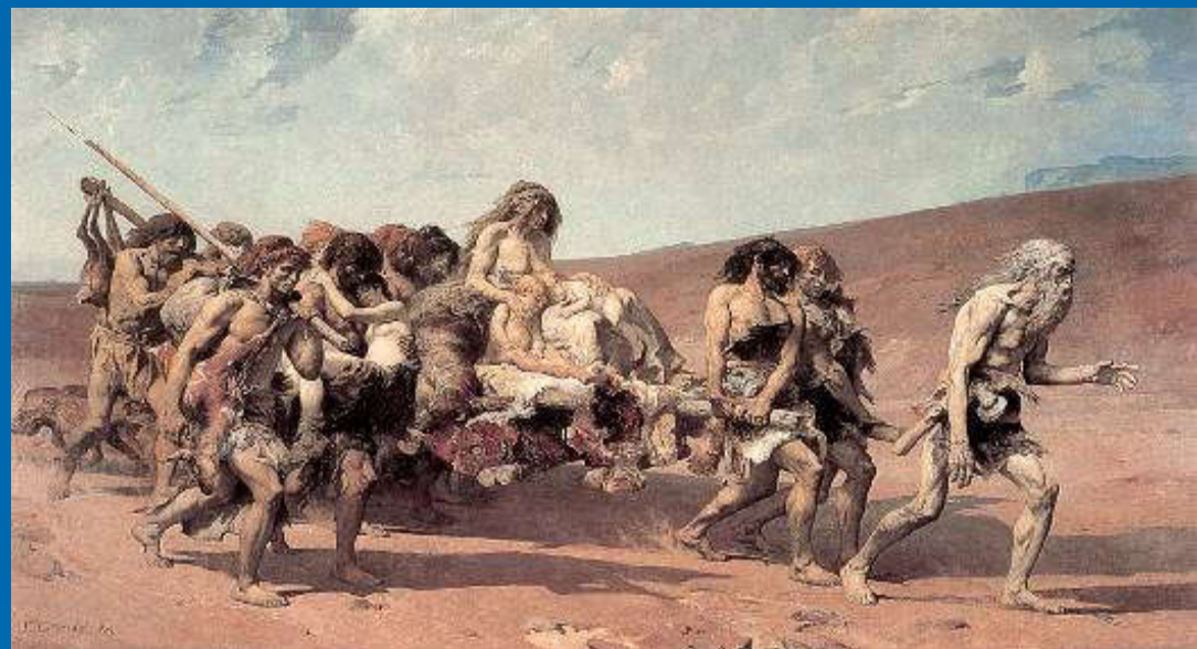
Fernand Cormon (1880), Kajin u zemlji Nod, Paris

➤ Prima znak אֹת ô t (!) – teološka riječ