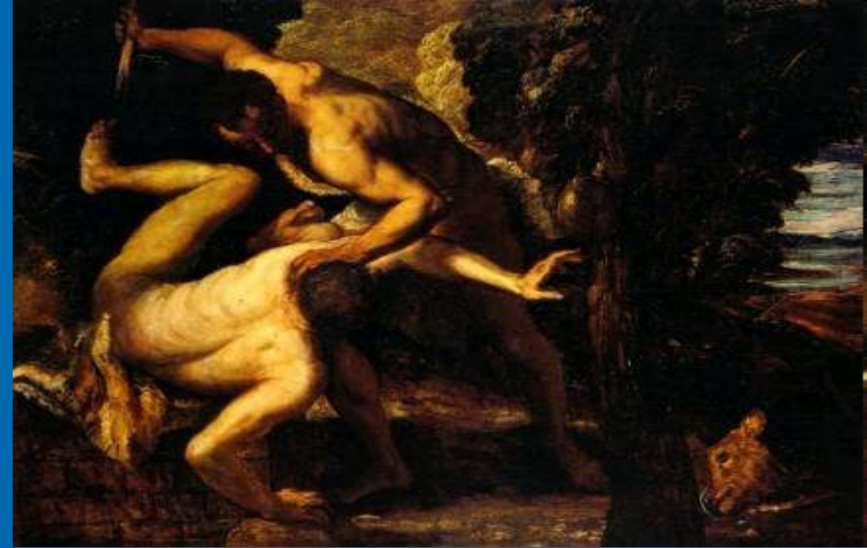
Tintoretto 1518 – 1594, Kajin i Abel ; Ulje na platnu (149 × 196 cm) — 1550-53