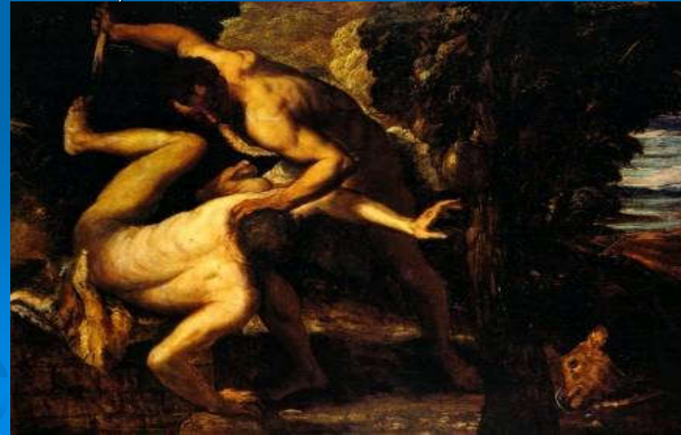
Tintoretto 1518 – 1594, Kajin i Abel; Ulje na platnu (149 × 196 cm) — 1550-53