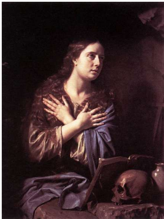
Philippe de Champaigne, Magdalena pokornica, Museum of fine Arts, Houston