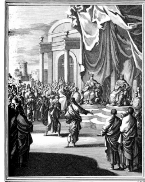
II PARAL. XVIII. Regibus in coram binis, Regumque Ministris, Ora ferit vatis pseudo-propheta sacri. Sic, quae facta launt alias mendacia plagis Impia veridicos excipit aula viros. Hier läßt der König eine auf, dessen Rücken liegen, der Fälscher Wahrheit. Obst du, wie sich dieses vom du gehst bei diesen zu. Sie man, sonst irrst die Lügen, so schüßt man da den Mund der derben Wahrheit heim.