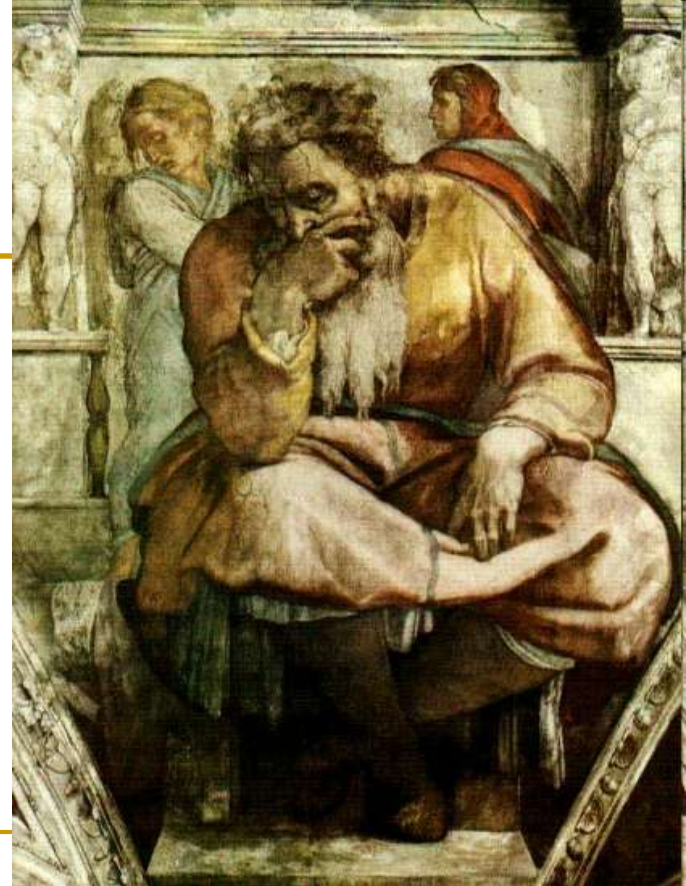
Michelangelo, Jeremija, Sikstinska kapelica