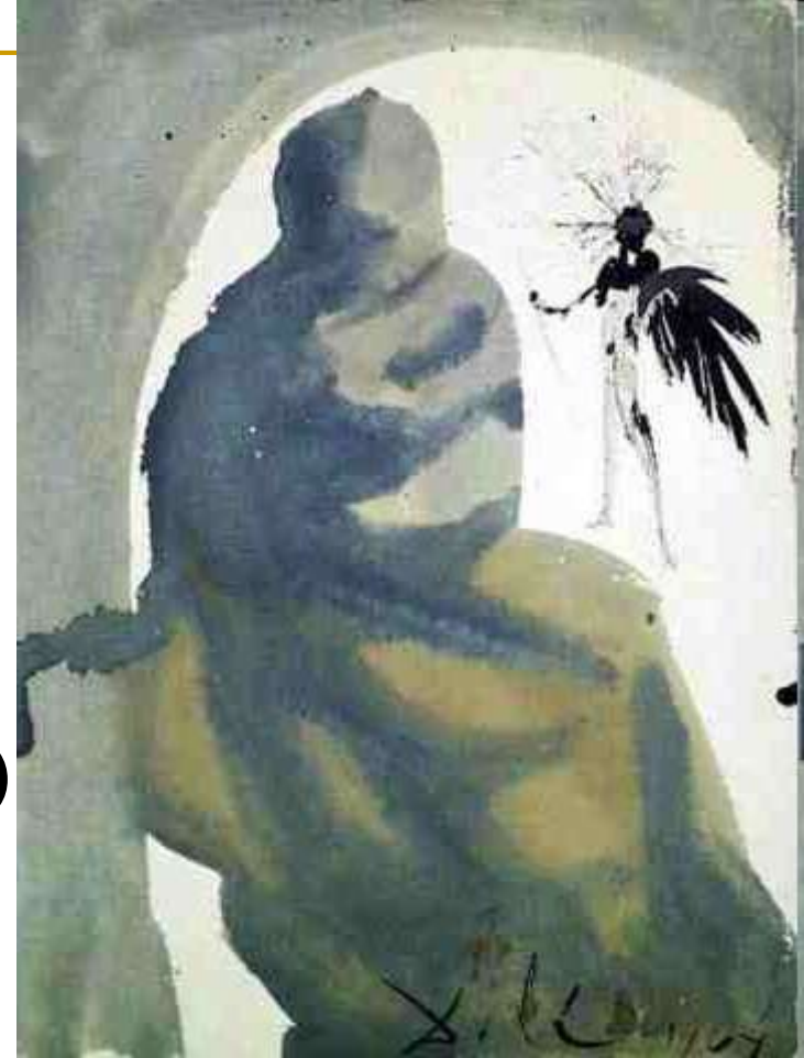
S. Dalí, Seduxisti me, Domine (1964.-67.)