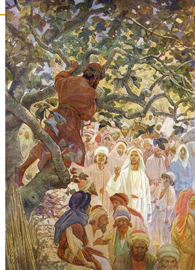
Zacchaeus In The Sycamore Tree by William Hole