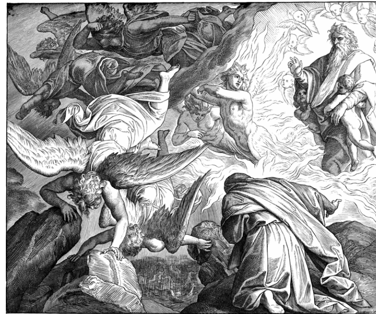
Der HERR erscheint dem Elia auf dem Berge Horeb.

Und siehe, der HERR gieng vorüber und ein großer Hauch Wind, der die Berge zerriß und die Felsen zerbroch, vor dem HERRN her, der HERR aber war nicht im Winde. Nach dem Winde aber kam ein Erdbeben, aber der HERR war nicht im Erdbeben. Und nach dem Erdbeben kam ein Feuer, aber der HERR war nicht im Feuer. Und nach dem Feuer kam ein Hauch sanfter Sausen.