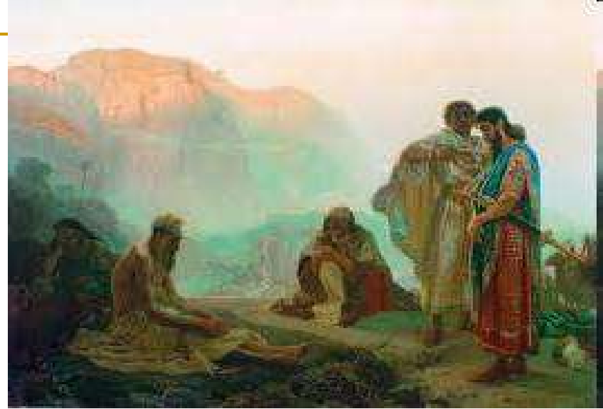
Ilya Repin. Job i prijatelji 1869. Ulje na platnu. The Russian Museum, St. Petersburg