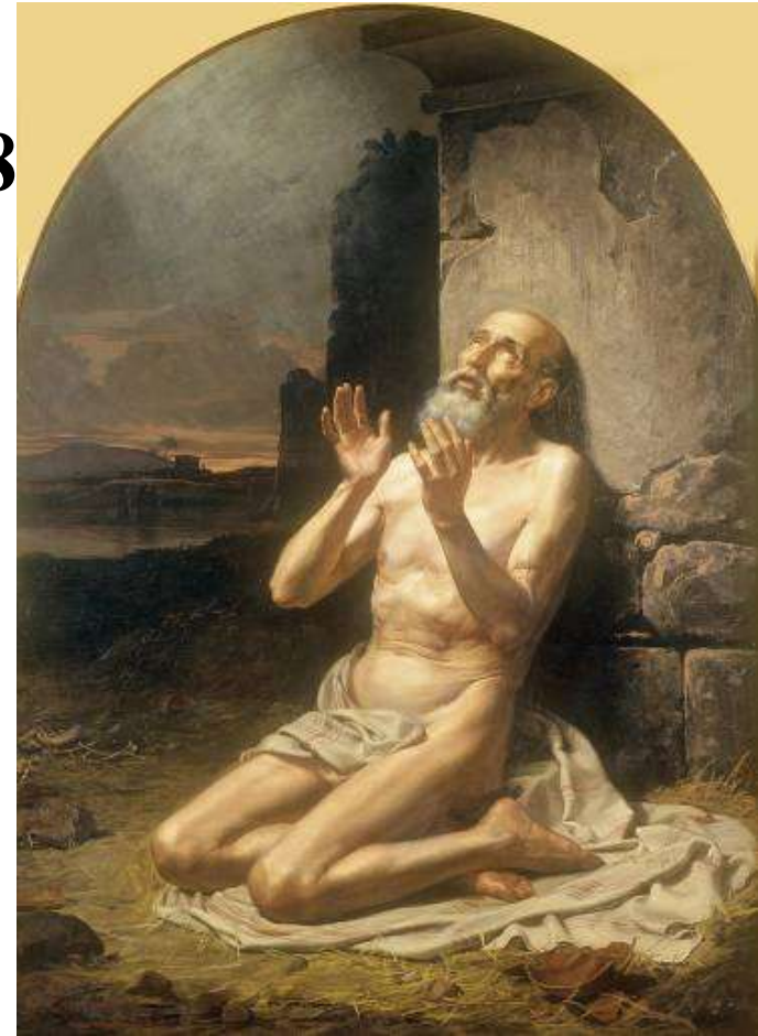
Gonzalo Carrasco, Job on the Dunghill. Oil on canvas, 1881. Museo Nacional