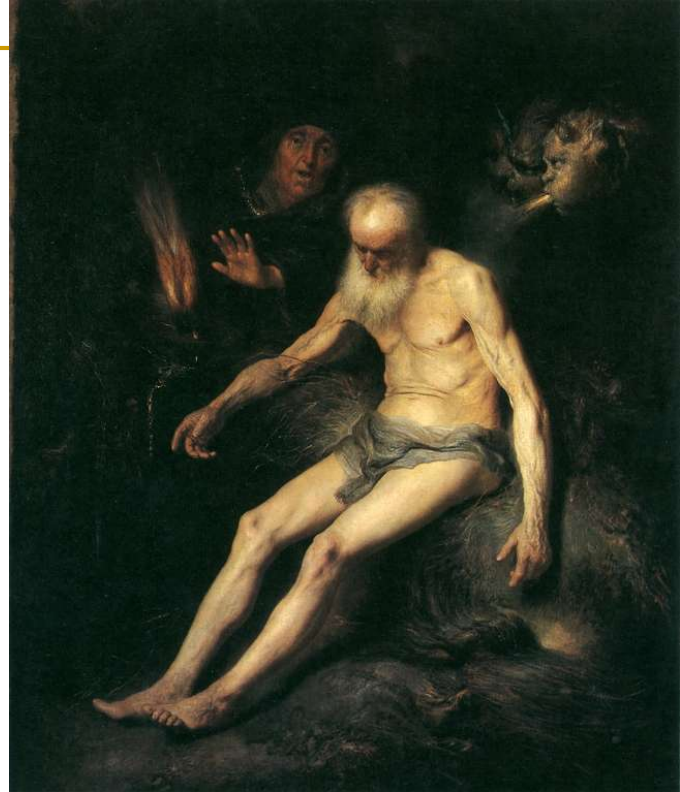
Jan Lievens, Job on the Dunghill, 1631