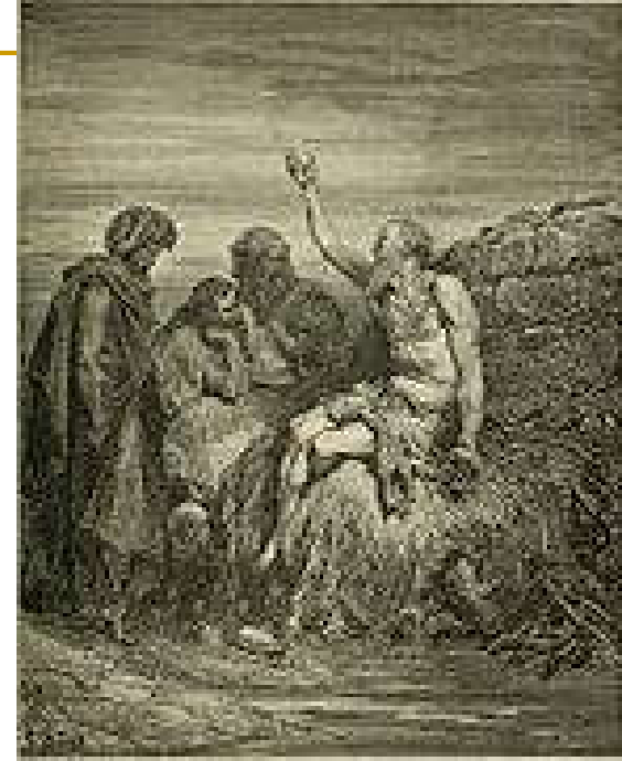
"Job and His Friends," one of Gustave Doré's illustrations for La Grande Bible de Tours