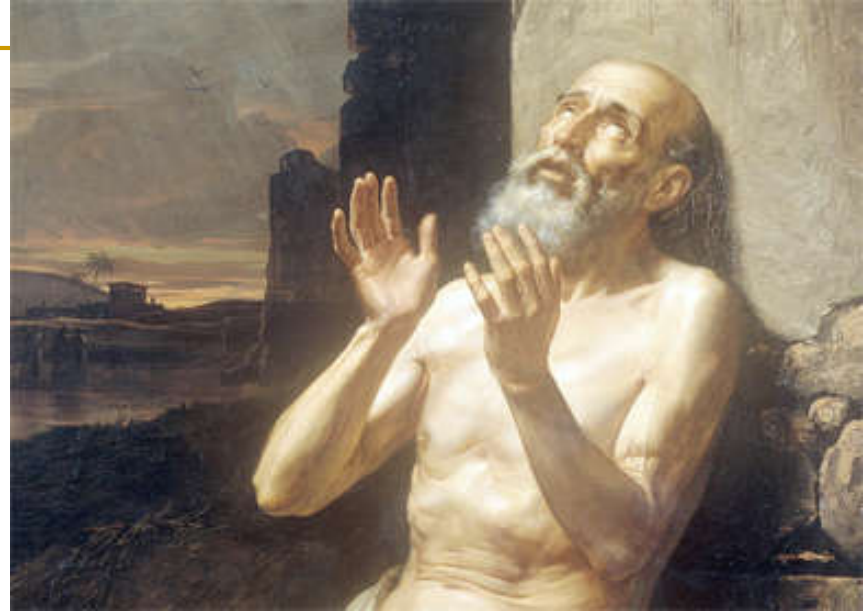
Gonzalo Carrasco, Job on the Dunghill. Oil on canvas, 1881. Museo Nacional