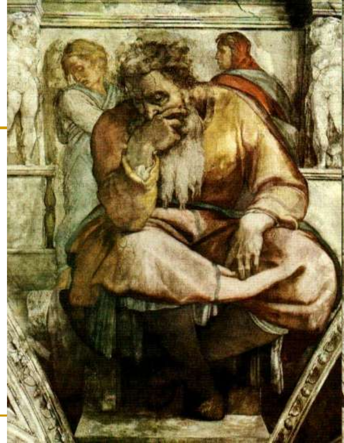
Michelangelo, Jeremija, Sikstinska kapelica