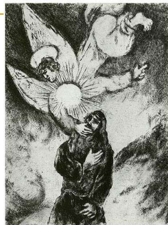
M. Chagall, Jeremijino zvanje, 1956.