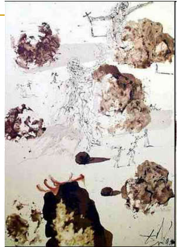
S. Dali, Omnes gentes in valle Josaphat Joel 3,21 (LXX), Biblia Sacra