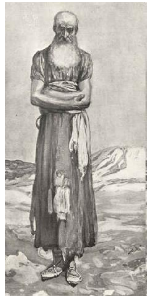
James Tissot 1836-1902; Prorok Nahum