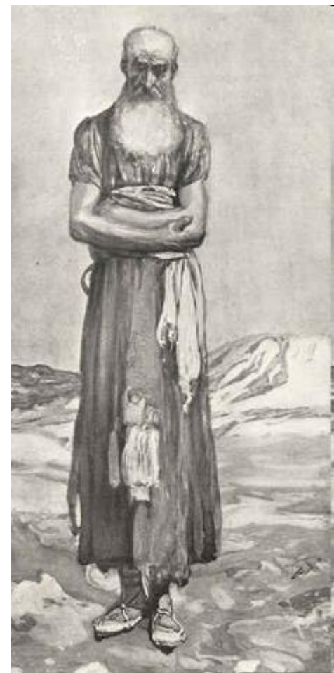
James Tissot 1836-1902; Prorok Nahum