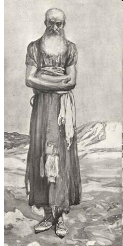
James Tissot 1836-1902; Prorok Nahum