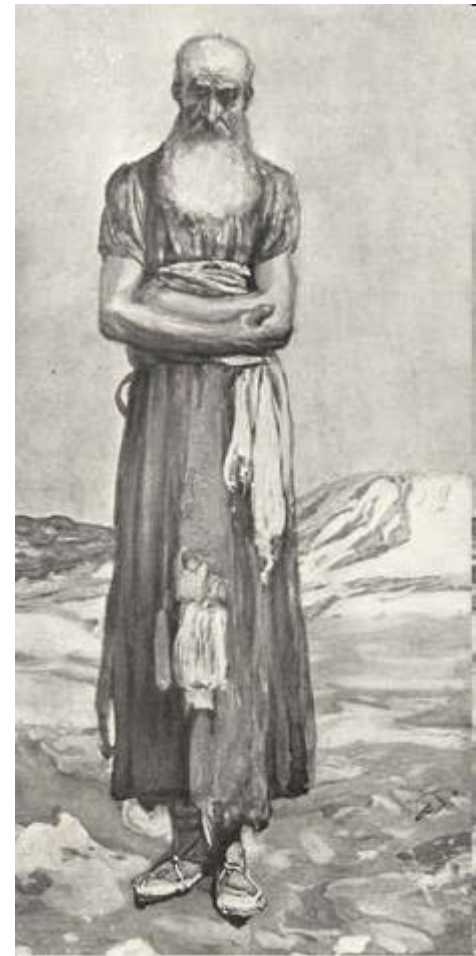
James Tissot 1836-1902; Prorok Nahum