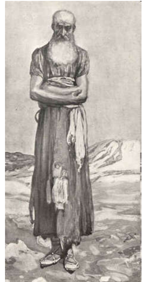
James Tissot 1836-1902; Prorok Nahum