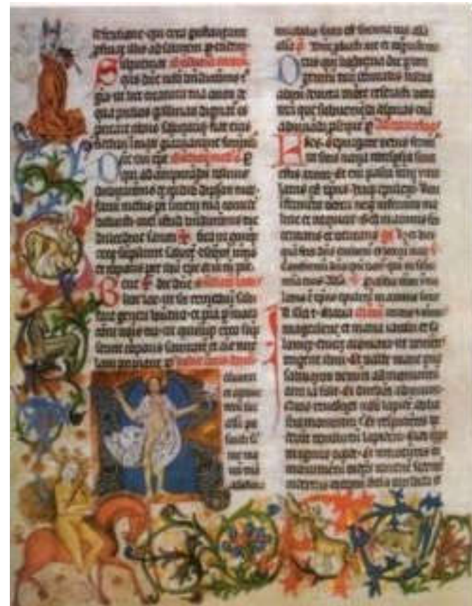
Svečana Biblija zagrebačke katedrale, XIV. st.