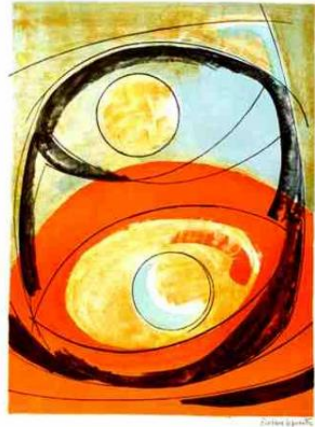
Barbara Hepworth, Postanak, litografija, 1969.