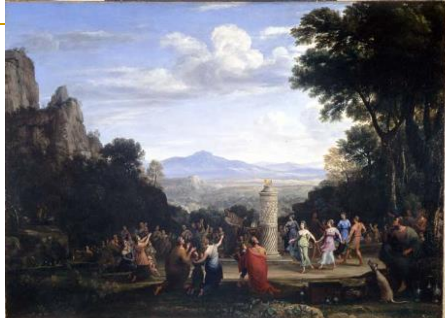
Lorrain Claude, Klanjanje zlatnom teletu, 1660.