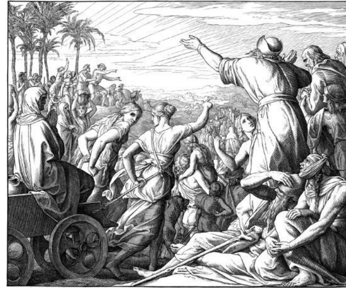
Die Rückkehr aus der babylonischen Gefangenschaft. Da machten sich auf die ebenen Süden aus Juda und Benjamin, und die Priester und Leviten, alle deren Hand GOTT erweckte, hinauf zu gehen und zu bauen das Haus des HERRN zu Jerusalem. Hud. Kap. 1. v. 5.