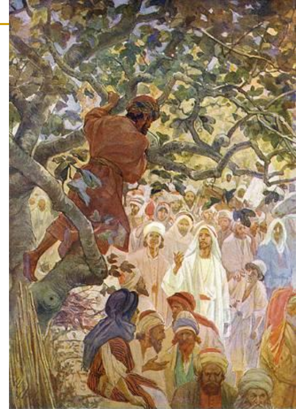
Zacchaeus In The Sycamore Tree by William Hole