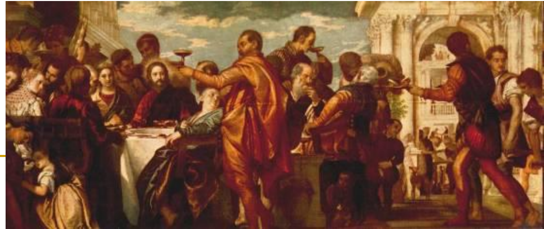
Paolo Veronese, Svadba u Kani (oko 1560)