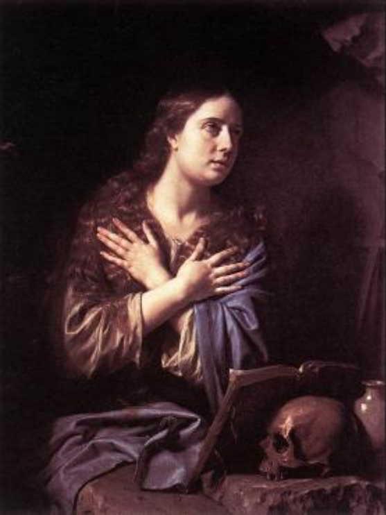
Philippe de Champaigne, Magdalena pokornica, Museum of fine Arts, Houston