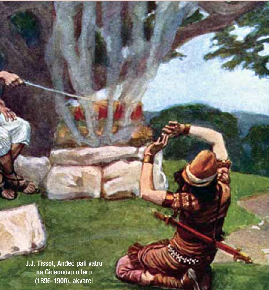
J.J. Tissot, Andeo pali vatru na Gideonovu oltaru (1896-1900), akvarel