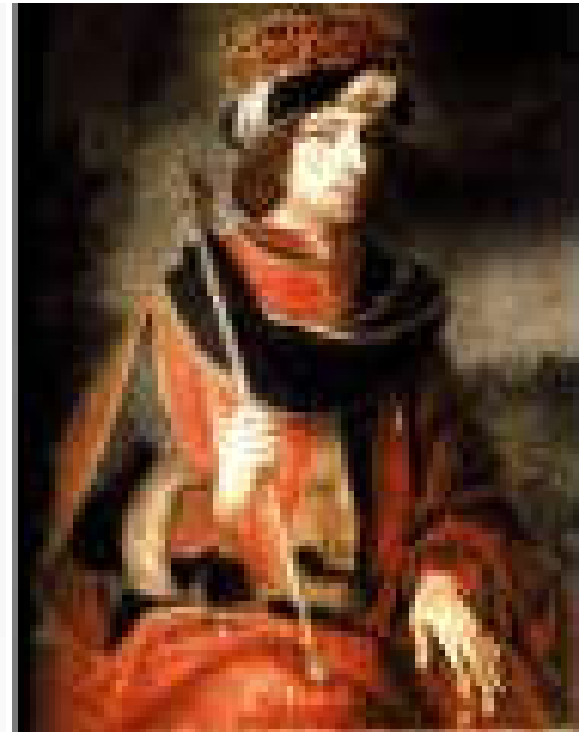
Jehoshaphat, with the symbols of monarchy – Spanish artist Pedro Berruguete (1450-1504).