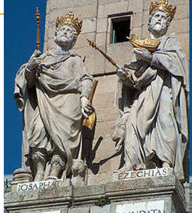
Jošafat i Ezekija, Samostan El Escorial.