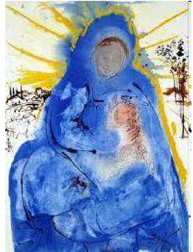
S. Dali: Djevica će roditi sina